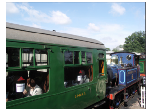
Eine Fahrt unter Dampf mit der Bluebell Railway ist immer ein Erlebnis.

Der Town Council von Haywards Heath und die Twinning Association hatten anlässlich des 20-jährigen Bestehens der Städtepartnerschaft zu einem Festwochenende eingeladen. Gerne ist man dieser Einladung gefolgt, um mit guten Freunden das Jubiläum zu begehen und eine lange gemeinsame Zeit zu feiern.