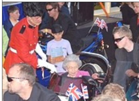
Besuch der Queen beim Triumph-Motorradtreffen in Newchurch

Es gibt viele Motorradtreffen und alle möchten sich natürlich voneinander unterscheiden. Oftmals gelingt es den Veranstaltern allerdings nur durch die jeweilige Motorradmarke. Ansonsten ist vieles gleich: Zeltstadt, typische Bikerbands und viel Alkohol. Natürlich ist das nicht überall so und ganz besonders nicht so in Neukirchen. Abgesehen von der Grundidee des Events - dass sich Neukirchen drei Tage