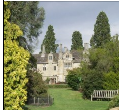
Bild: Wakehurst Place Nähe Ardingly

Sussex, kaum eine andere Grafschaft in England verfügt über eine solch reichhaltige Geschichte und phantastische Landschaft: eindrucksvolle Küsten, herrliche Gärten, imposante Burgen und liebeliche Dörfer. Der Freundschaftsclub plant Anfang September 2013 eine Reise in den zauberhaften Süden Englands und erkundet von der Partnerstadt Haywards Heath aus die Grafschaft mit ihren vielfältigen Sehenswürdigkeiten. Ein ausführliches Programm erscheint in den nächsten CLUB NEWS und ist ab Februar 2013 bei den Vorsitzenden erhältlich.